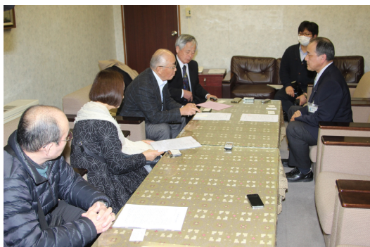
尾花市長に要請書を提出するあざみの会のメンバー（向かって左側の4人）