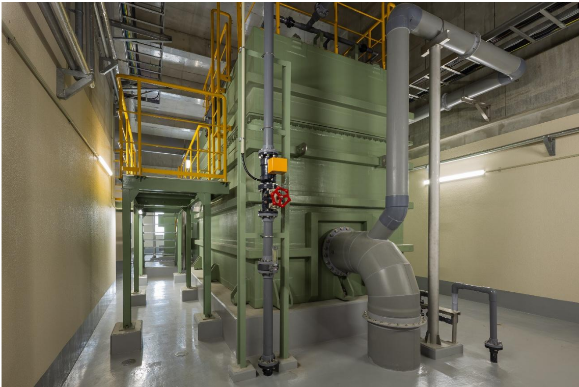
生物脱臭装置（令和8年3月撮影）