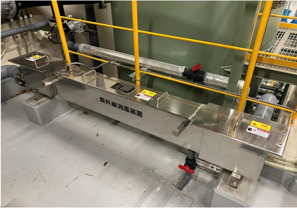
紫外線消毒装置（令和8年3月撮影）