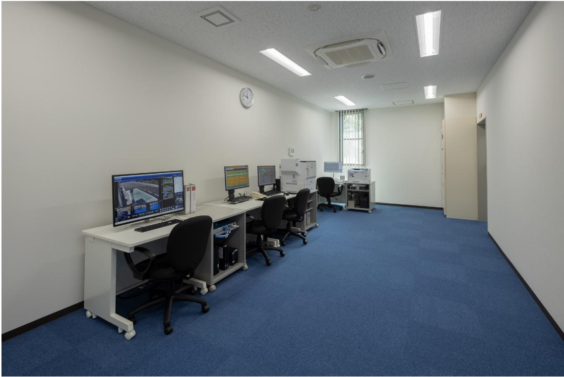
中央監視室（令和8年3月撮影）