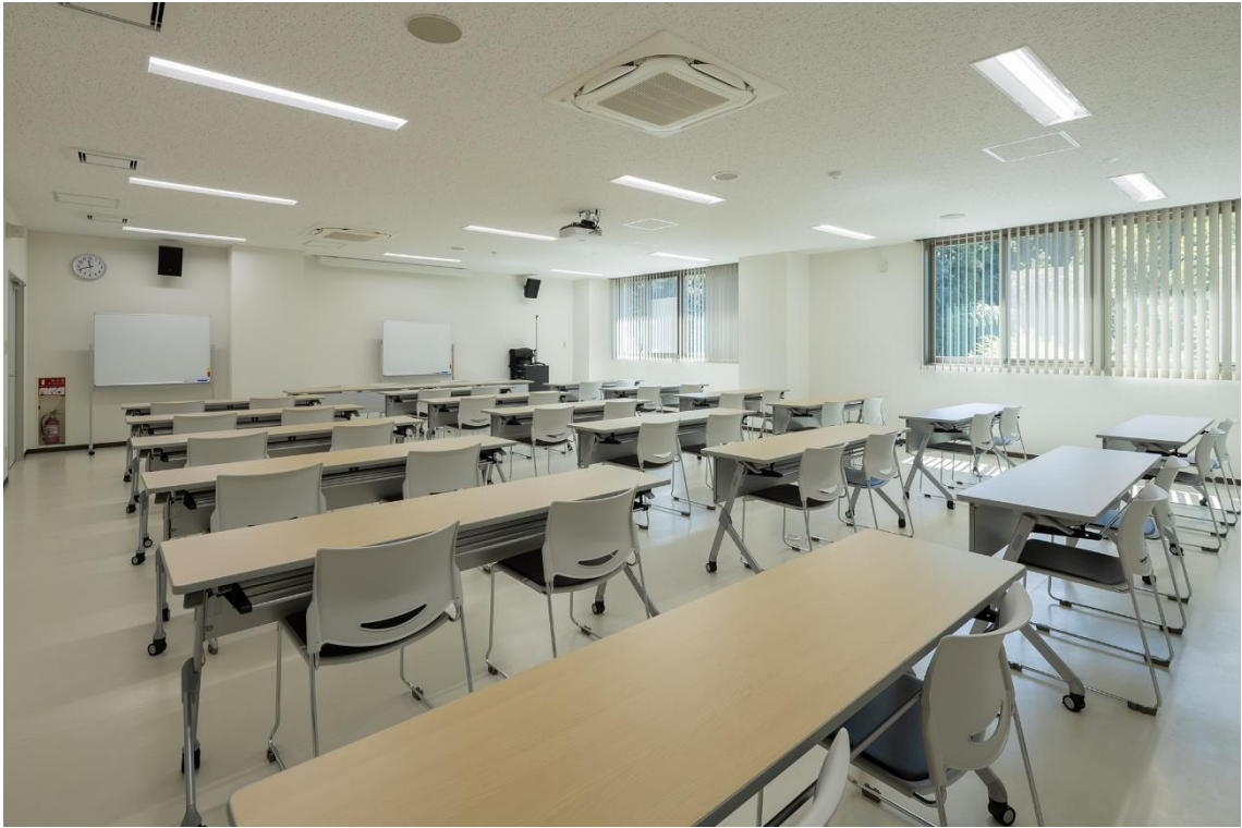
会議室（令和8年3月撮影）