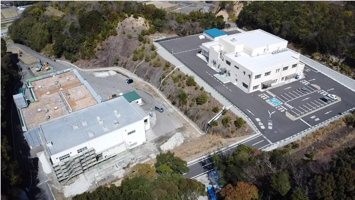
新施設及び旧施設解体工事現場 (令和8年3月撮影)