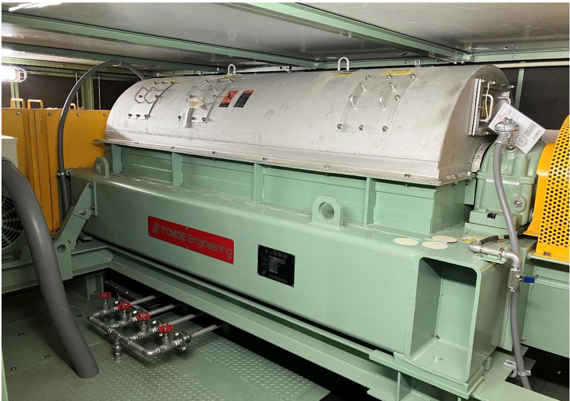
遠心脱水機（令和8年3月撮影）