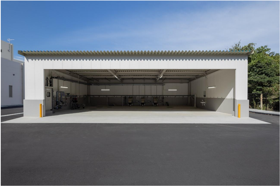
洗車場（令和8年3月撮影）