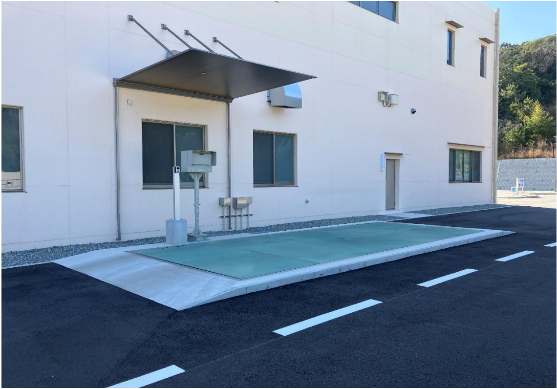
トラックスケール（令和8年3月撮影）