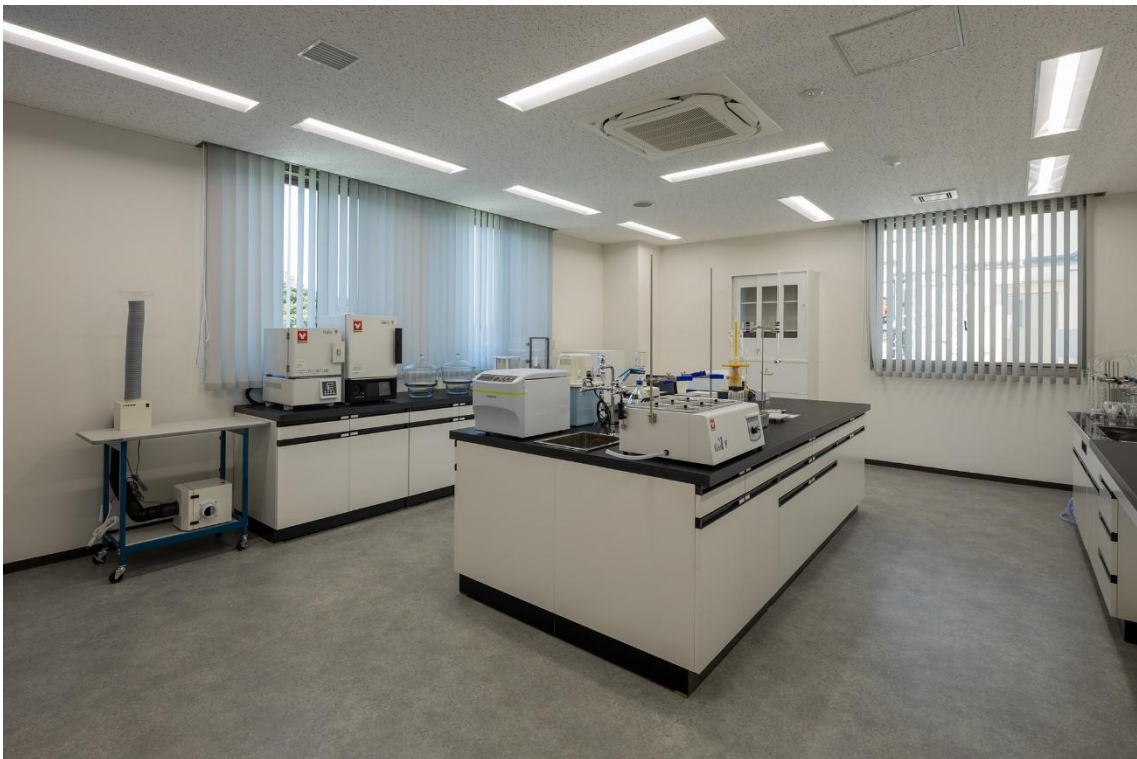
水質試験室（令和8年3月撮影）