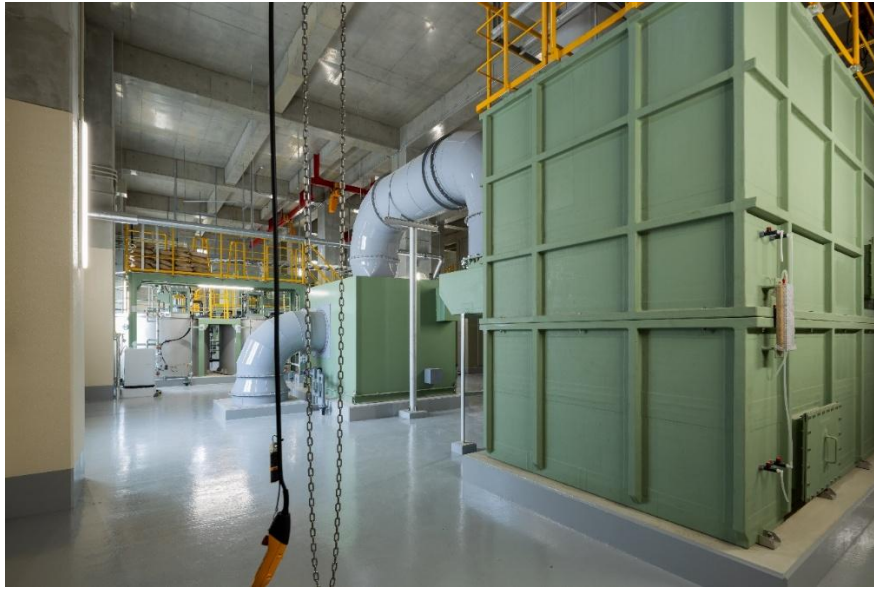
低濃度臭気活性炭吸着塔（令和8年3月撮影）