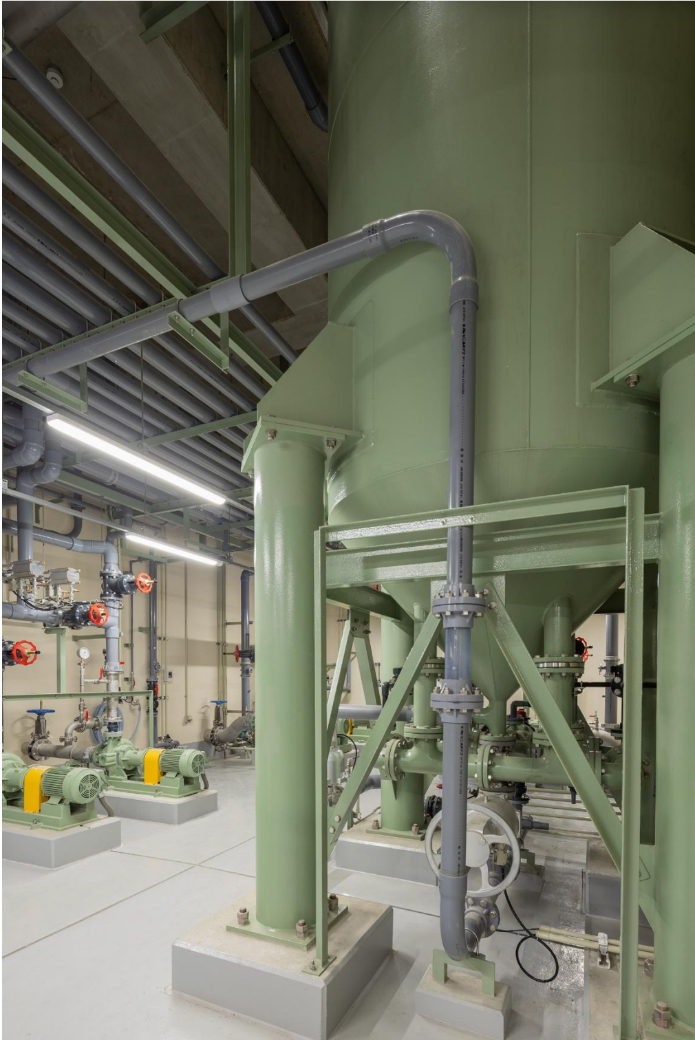
活性炭吸着装置（令和8年3月撮影）