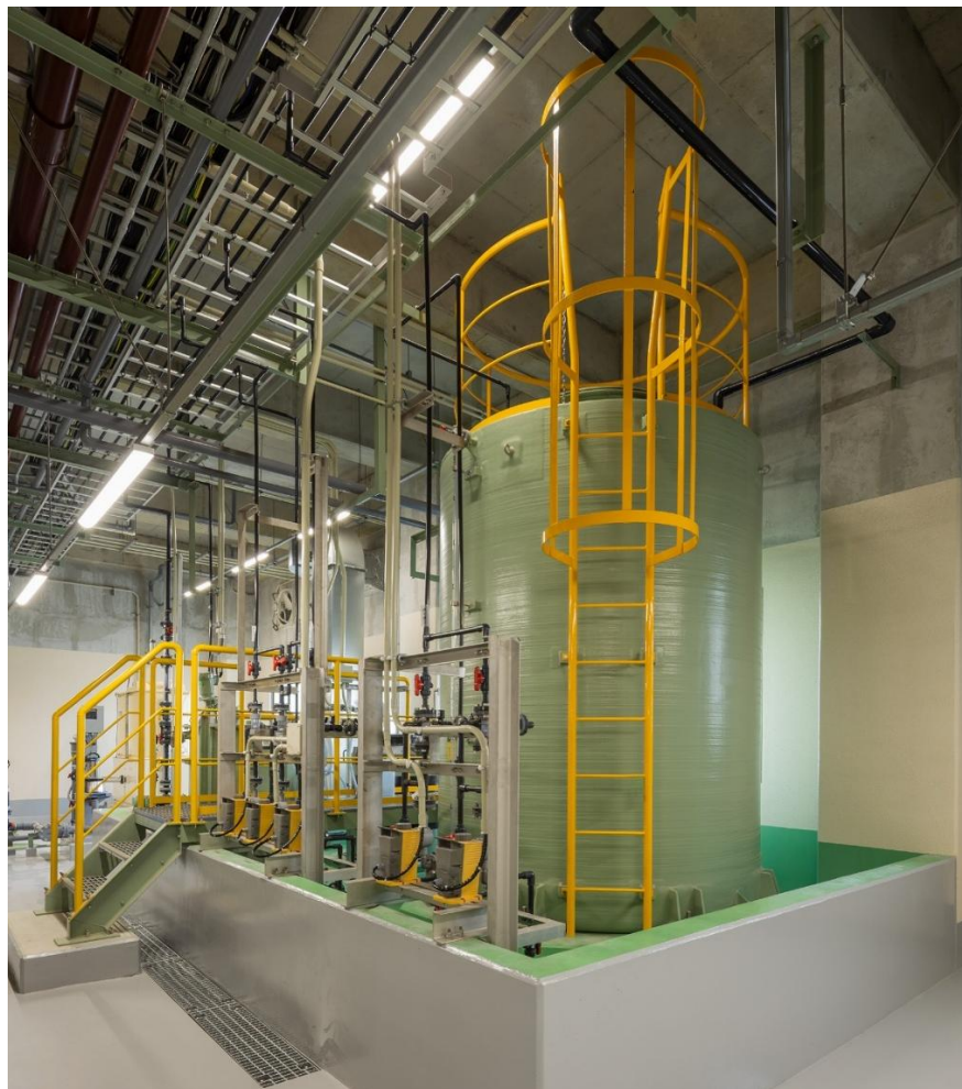
薬品貯槽（令和8年3月撮影）