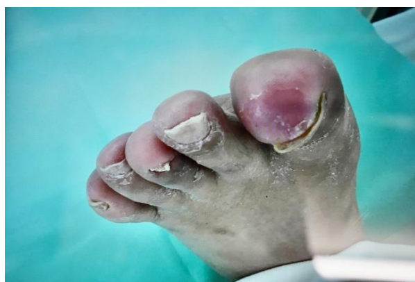
図3. レオカーナによる LDL 吸着療法の結果 （上）レオカーナ治療施行前，（下）20回のレオカーナ治療施行後