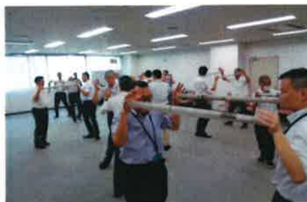
新聞紙を使っての実技模様