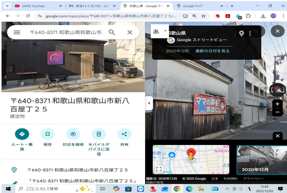
向かって右側が建替前の物件であり、左側が建替後の店舗