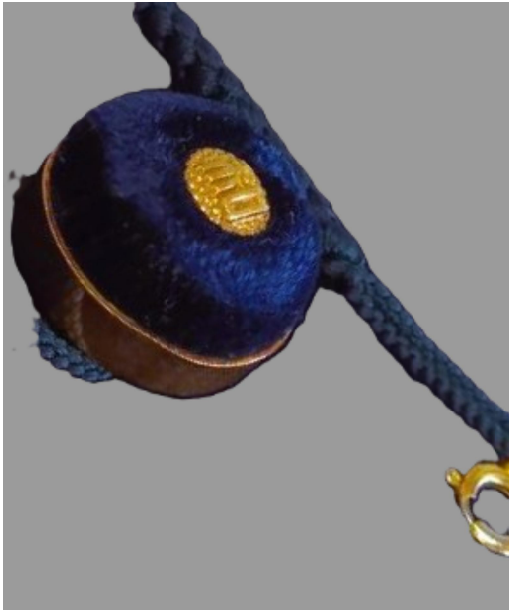
14金の議員バッチ。中心に「和」の文字が特徴。