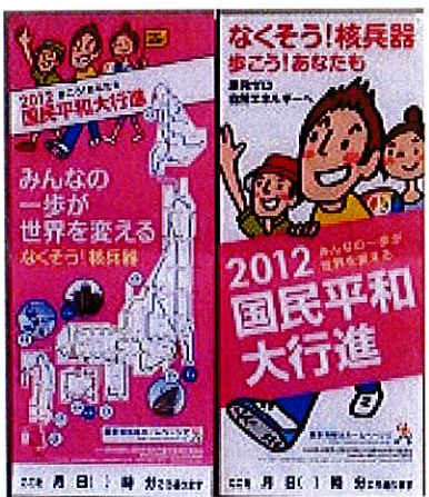
今年のポスターです