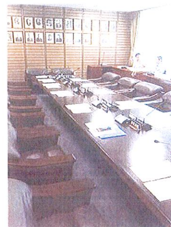
6月県議会にむけて議会運営委員会が開かれ、会期を6月11日からとすることで合意しました。補正予算など16議案他が予定されていて、午後の県議団会議でレクチャーを受けましたが、何も特典はありません。(松坂県議のブログから)