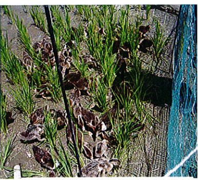
アイガモ農法で「高付加価値米」の米作農家の水田、梅原地区で

私は、せめて和歌山市の農業と農地の保存のために、これまで「生産緑地制適用と要件緩和」「新規就農者への支援策」「農地転換の厳格化」「市民農園の拡大」「農業生産法人の育成」「農協（JA）への支援策」「農業用水路の確保と保全」「農業用水の通年通水」等々、市議会また市農業委員として奮闘してきました。 このこと、奮闘してきた市の農業と農地保全策がTPPへの参加によって消滅してしまうのではないかと、危機感をもち一人です。 耕作放棄地が増え、米作農家が米をスーパーで買い求める事態となりかねません。農家を含め140万人の雇用が失われる、といわれています。 TPP参加を認めない運動をさらに強める必要があります。