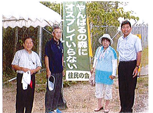
沖縄県東村高江のヘリパッド予定地の監視小屋を訪れた党県議団

沖縄では基地がない方が雇用も生まれ経済もよくなるということが広がってきているという話はとても勇気づけられるものでした。次号でそのお話をしたいと思います。(S.M.)