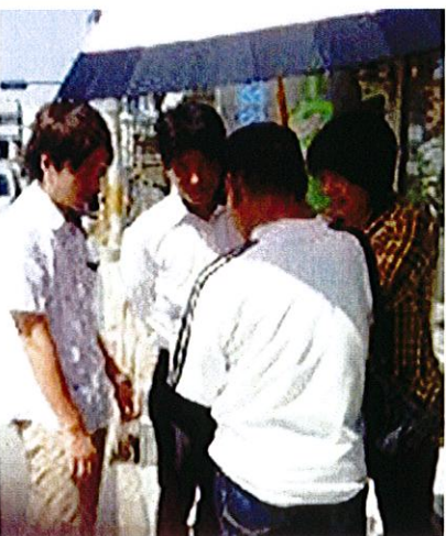
ハローワーク前での聞き取り調査