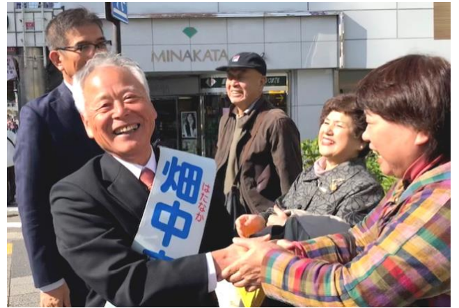
最後の最後まで絶大なご支援を!

——奥村のり子生活相談所—— 〒640-8212 和歌山市杉ノ馬場 1-11 TEL & FAX 073-427-7121 Eメール w-jcpken@naxnet.or.jp