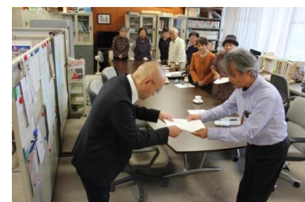
上の写真は紀の川駅をよくする会からな要求を県に提出

お願い 日本共産党は来年1月に第28回党大会を開催します。この大会では党綱領の一部改定ということになり、世界情勢なども改訂されそうです。日刊赤旗では大会書議案の議案も6日付から公表されています。ぜひお読み下さい。